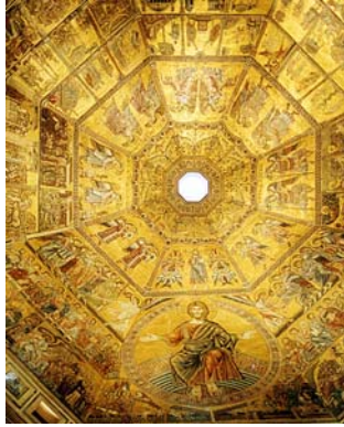
Jacopo da Torriti, Koepelmozaïek, Baptisterium, Florence, rond 1225 tot in de 14 e eeuw.