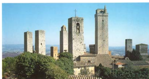
6. San Gimignano, Toscane