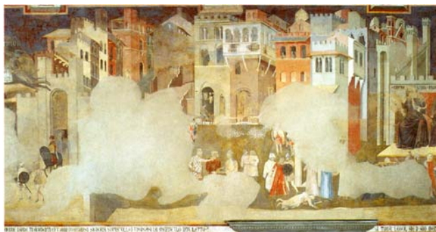
5. Ambrogio Lorenzetti, Slecht regeren, 1338, Siena

Een veel beroemder fresco van Lorenzetti in de raadzaal van het stadhuis van Siena, de sala della pace , uit 1338-39, is een voorstelling van de stad onder een goede regering en de stad onder een slechte regering. Omdat het uitdrukkelijk een stad betreft spelen de gebouwen een belangrijke en zeer eenduidige rol. Hier gaat het toch vooral om de stad als materieel product dat de tekens van een goede en een slechte regering moet tonen. Natuurlijk zijn de gebouwen enigszins geschematiseerd en verdringen ze elkaar om een zichtbare plaats te veroveren. Maar ze worden hier toch in hun materialiteit als gebouwen ten tonele gevoerd. Dat is overigens wel een rol die we nog niet echt gezien hebben: de stad als blad waarop de tekens van de politiek op worden gegraveerd. Het boeiende is dat er een aantal overduidelijke tekens samengaan met moeilijk te interpreteren tekens, waarvan men zich moet blijven afvragen of ze intentioneel zijn.