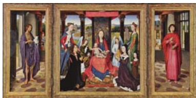
Hans Memling the Donne Triptych, 1478, National Gallery.

Het is in dit geval zinvol om deze annunciatie te vergelijken met een schilderij van meer dan honderd jaar later, geschilderd in Brugge door Hans Memling.