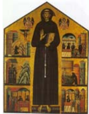
Bonaventura Berlinghieri, Franciscus Paneel, Pescia, San Francesco, 1235

Dante kende het mozaïek van het Baptisterium van Florence goed. Het werd het model voor zijn episch gedicht over de Hemel, het Vagevuur en de Hel. Het witte centrum van het mozaïek, de lichtkap, is onbepaald gebleven in betekenis. We weten niet of het een symbolische lading moet hebben, terwijl dat natuurlijk wel voor de hand ligt. Immers gaat het om een wit helder licht, een leegte waaromheen de drukte van de verhaal en het organogram van de hemel samen in een zelfde matrix worden gezet. Zou God zich daar nestelen?