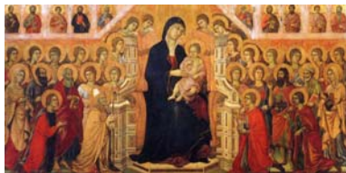
1. Duccio di Buoninsegna, Maèsta , 1311, Siena Museo dell'Opera del Duomo