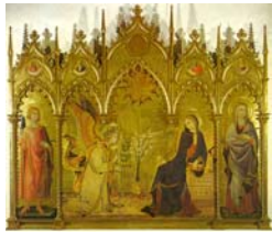
Simone Martini, Annunciatie, 1333, Uffizi

In Simone Martini's Annunciatie uit 1333 is een volgende stap te zien in de architectonische ordening van het tafereel. Het kader van het schilderij is nu verworden tot een schitterend scherm, een koorscherm eigenlijk, architectonisch vormgegeven in vijf traveeën waarvan de centrale travee de breedste is en als een triumpfoort motief het geheel centreert. Het altaarstuk betreft wederom, maar nu op een duidelijkere manier, een soort doorsnee van een gebouw. Dit keer van een hallenkerk met twee zijbeuken aan weerszijde van het middenschip. De architectuur speelt actief mee in de ordening van het verhaal. De twee buitenste traveeën zijn van de drie middelste afgezonderd door middel van slanke getorste zuilen. In de ruimte die zij definiëren staan twee heiligen als getuigen. Als je naar de grond kijkt zie je dat het hier geen continue ruimte betreft. De twee heiligen staan apart van de gebeurtenis. Slechts de gouden lucht zou kunnen suggereren dat het hier om de zelfde ruimte gaat, maar dat wordt duidelijk door de grond tegengesproken. Het gaat hier om een aanwezigheid zonder presentie, zonder getuigenis. De annunciatie is blijkbaar een uiterst intiem moment. Het betreft immers de bevruchting van Maria.