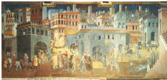
4. Ambrogio Lorenzetti, Goed Regeren, Siena, 1338