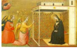
Bernardo Daddi, Annunciatie, rond 1330