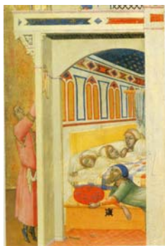
Ambroggio Lorenzetti, De liefdadigheid van Sint Nicolaas, rond 1340

Op een klein, hooggeplaatst raampje legt een jonge Sint Nicolaas de bruidschat waardoor de drie slapende dochters van de wakkere doch onbemiddelde man kunnen trouwen. Het is een verhaal van gulle liefdadigheid die Sint Nicolaas tot een van de belangrijkste heiligen van de christelijke wereld heeft gemaakt. De ruimte lijkt eenvoudig, maar is complex. Het paneel is verdeeld over twee verticale velden en construeert zo een ruimte voor voyeurisme, mysterieuze glimpen en een bescheiden en anoniem bedoelde liefdadigheid die niettemin getuigen heeft. Een smalle