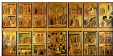
2. Duccio di Buoninsegna, Maèsta-achterzijde met 26 passiescènes , 1311, Siena Museo dell'Opera del Duomo